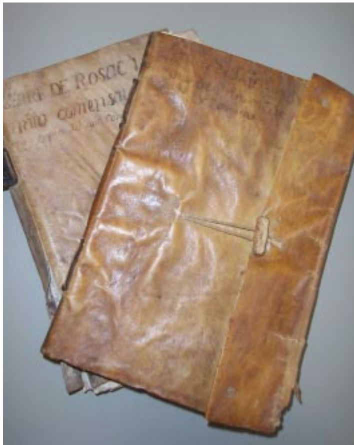
El Llibre de talles de l'any 1710 i el Llibre del rosac de l'any 1754.

Aquesta documentació, donada a l'Arxiu, arrenca del segle XVI i en part, ja està detallada en dos inventaris "de todos los papeles y documentos existentes en el archivo municipal", datats l'any 1927 i