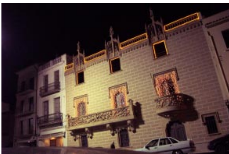
Imatges de les lluminàries que s'han posat aquest any als carrers, places i edificis de Cassà, per les festes de Nadal