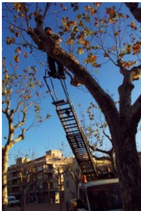
Dos moments de la instal·lació dels llums als arbres del passeig a càrrec d'operaris de la brigada municipal

L'altra novetat destacada d'enguany en aquest apartat, ha estat la col·locació de garlandes de llums en diverses branques dels arbres del passeig, amb l'objectiu de