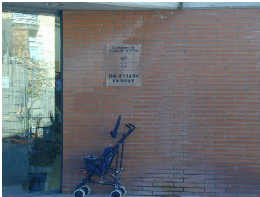
L'entrada a la llar d'infants de Cassà

Si a això hi afegim un increment de natalitat relativament