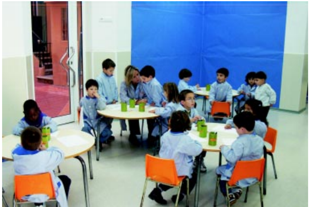
Activitats del programa Ulises dels alumnes de P-3

També vam veure alguns boletaires com buscaven bolets, alguns amb molta sort, ja que portaven el cistell força ple.