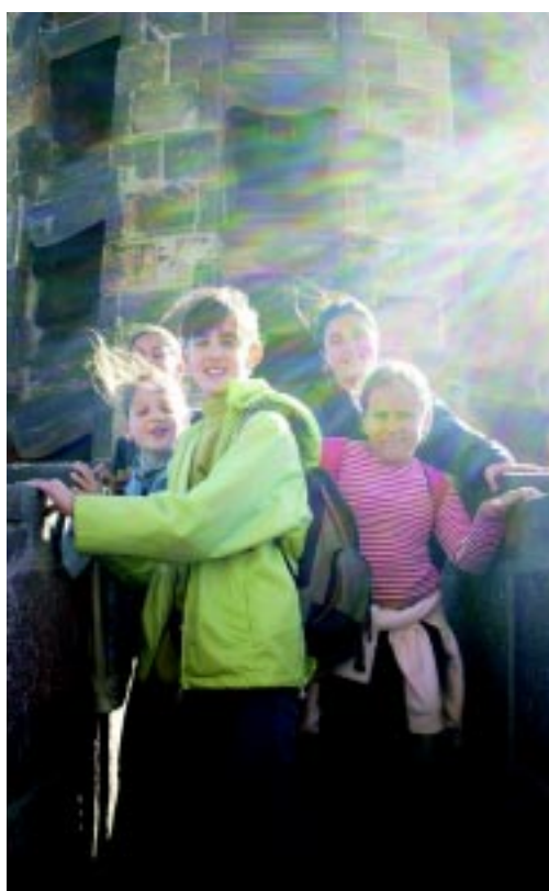
Els de cicle mitjà de primària, d'excursió al Puig de Cadiretes; fent activitats del programa Ulisses; la sortida dels de 5è a veure l'obra de Gaudí; i una mostra de treballs manuals