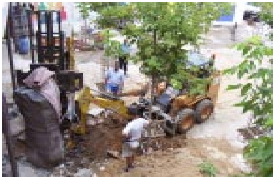
Dos moments de les tasques de trasllat del monòlit que hi havia en un dels patis del col·legi