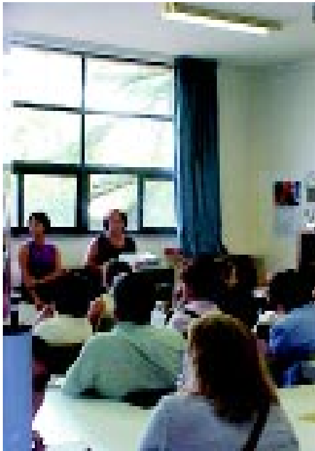
Reunió de pares del alumnes de P-3, prèvia a l'inici del curs 2002/2003.

s'havia de tenir en compte la nostra opinió. Amb tot i això, cal felicitar la dedicació que aquest estiu ha tingut l'ajuntament i els seus treballadors envers la nostra escola i esperar que el proper any es pugui mantenir aquest ritme per tal de superar a curt termini les mancances que encara tenim.