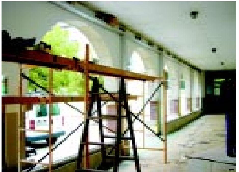
Vista de l'acondicionament del jardí d'entrada i una instantània del procés d'instal·lació del tancament de les galeries

tituït les persianes d'unes aules que donen a aquest pati i s'han col·locat caixes de persiana. Si a tot això hi afegim el mobiliari nou de la secretaria, enguany podrem dir que la millora de l'aspecte de l'escola ha fet un pas endavant conside-