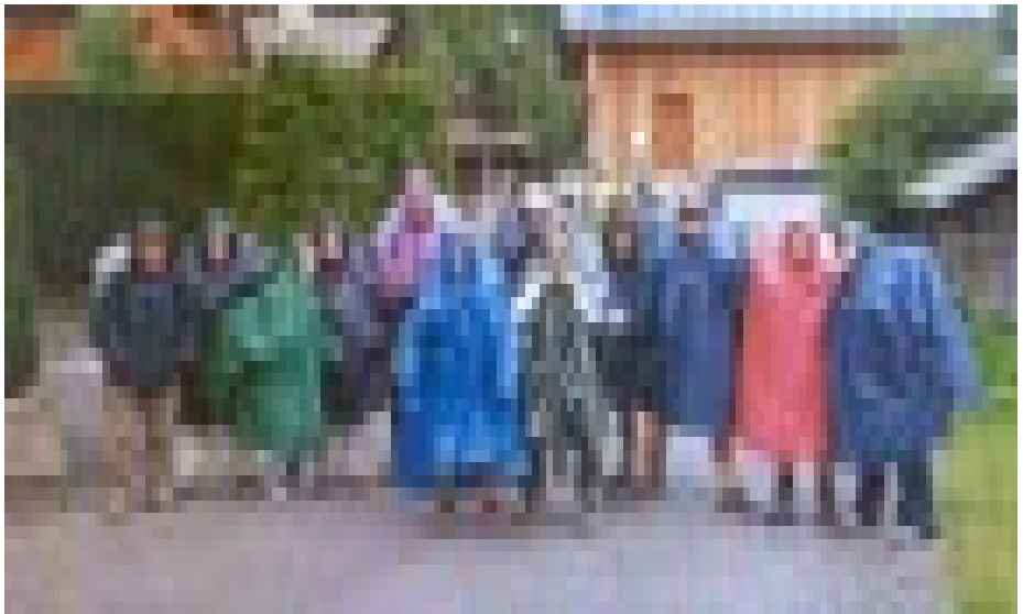
El primer dia de ruta, quan va començar a ploure