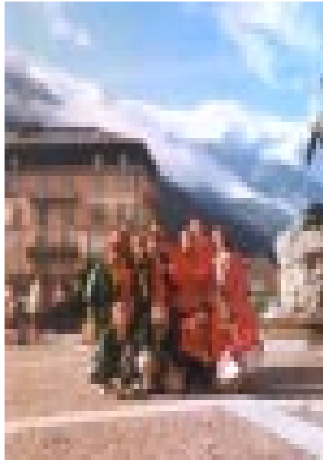
A l'esquerra, amb uns escocesos a Kandersteg; l'altra imatge, és la foto oficial del grup a Chamonix, amb el Montblanc al fons.

nal (com cada dia) i caminem tot el dia sense pluja. Anem fent per camins bastant amples fins que ens trobem davant un coll altíssim que ens toca pujar. Arribem cansadíssims a dalt i allà hi ha una cabana per esperar-s'hi a recés. Hi fem un mos i continuem per un caminet que ens porta directe al segon refugi. Per primer dia ens dutxem amb aigua calenta, coneixem uns caminadors francesos que ens anirem trobant al llarg d'uns dies i mengem calent i bo (cus-cus i tot).