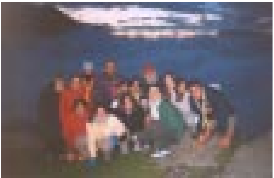
Al primer refugi, Tre la Tete