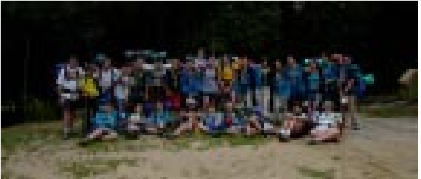
El grup de rangers i noies guies que va acampar el passat agost a la vall de Bianya; a sota, l'hora del sopar