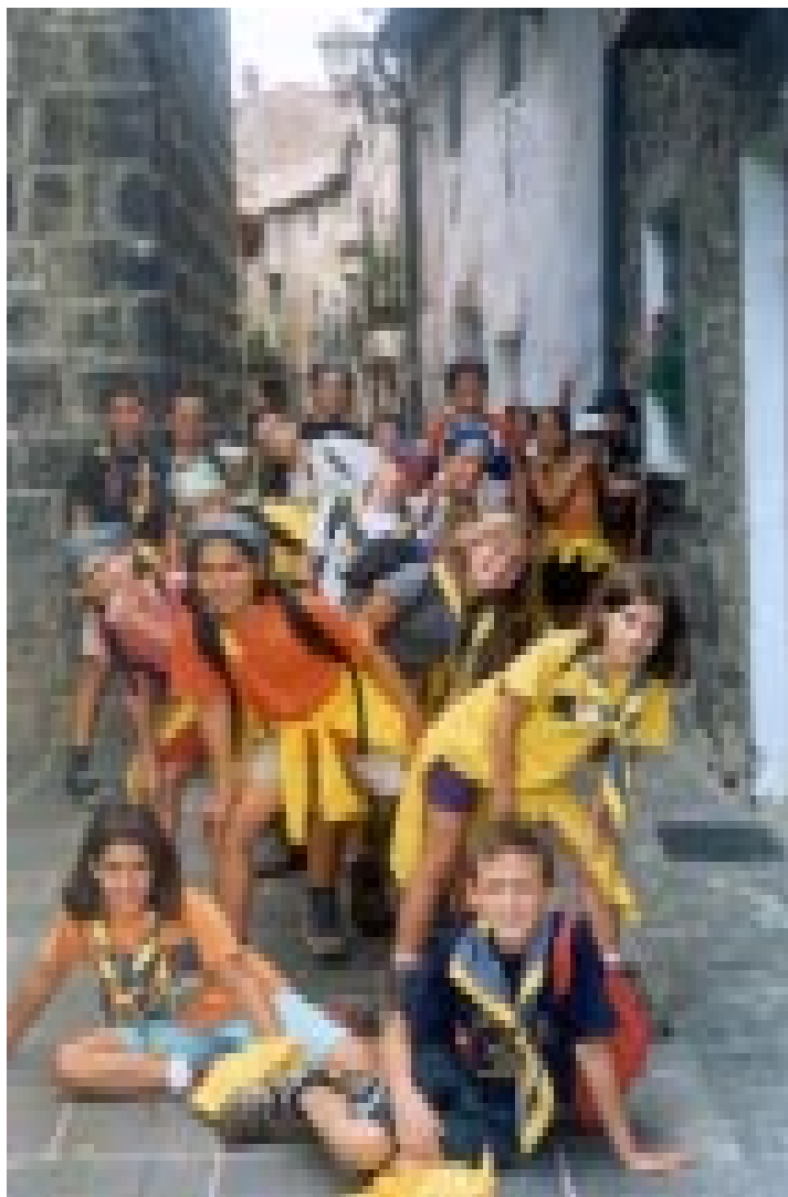
El grup de Llid's el dia que va anar d'excursió a Castellfolit de la Roca, on va participar en un joc d'investigació