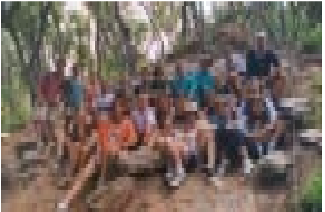
Tots junts a la muralla; però vigilant de no fer caure cap pedra

En primer lloc, cal dir que organitzar una activitat d'aquesta mena comporta molt d'esforç, així que els monitors volem donar les gràcies a totes les persones que han donat el suport necessari per a fer realitat el projecte. Són molts els detalls que han de coordinar-se perquè una cosa així funcioni i, un cop comprovat que tot ha surtit bé, tots hem d'estar molt satisfets dels Camps de Treball de Cassà. Hem donat a conèixer el nostre poble a 20 nois i noies de tot Catalunya, a través de l'excavació del poblat Ibèric del Puig del Castell. Des de La Sènia a Roses, de la ciutat de Barcelona i rodalies fins a Olot i Santa Pau, ... joves de molts racons de Catalunya han conegut Cassà i han marxat amb ganes de tornar-hi; de fet, la majoria va fer-nos una visita sorpresa un cop