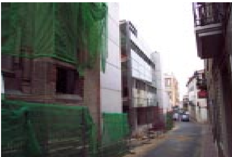
La sala Galà està agafant la seva fesomia definitiva

corresponien a la realitat i havia donat una visió massa optimista de com havia anat la festa. Bagué va respondre amb acritud recordant que, quan ERC governava a l'ajuntament, els balanços arribaven molt més tard i va dir que encara s'arrossegaven comptes de festes anteriors i dels actes de Ciutat Pubilla.