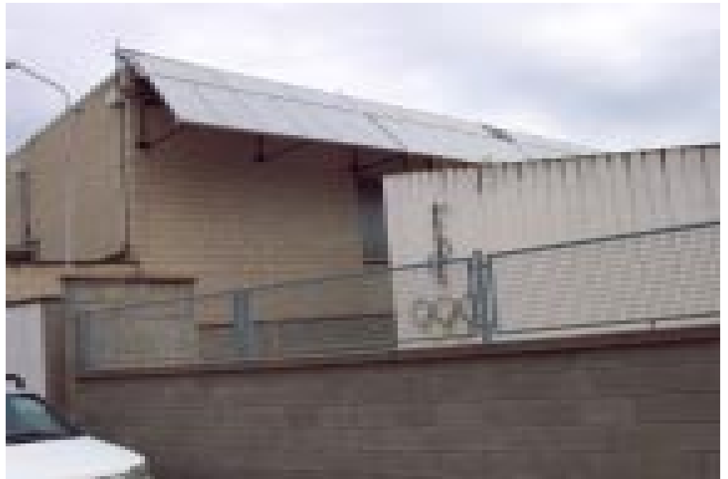
Els panells solars instal·lats al pavelló d'esports permetran un important estalvi d'energia per l'escalfament d'aigua

La sessió de juliol també va aprovar el conveni entre l'ajuntament i la Generalitat, que servirà per tirar endavant les obres de la girola entre l'antiga C-250 i la Rambla 11 de setembre, a l'altura de les cases barates. El conveni, tal i com va explicar l'alcalde servirà per cloure una llarga temporada de negociacions entre el poble i el govern català, que s'havien iniciat ja quan Pere Macias era conseller d'Obres Públiques. Al final, la firma de l'acord servirà també per formalitzar la cessió de la Generalitat a Cassà del tros de l'antiga C-250 al seu pas per la nostra vila, en els trams dels carrers Marina i Provincial. En la proposta, que té un pressupost total de 250 mil euros (43 milions de pessetes) es preveu que la Generalitat arranjirà el ferm d'aquesta travessia, es millorarà l'enllumenat i que a més posarà contenidors soterrats a la zona. Baulida va afegir que un cop estigui fetala rotonda es podria pensar a fer un monument al taper a la zona, tal i com havien demanat en un ple anterior els regidors d'ERC.