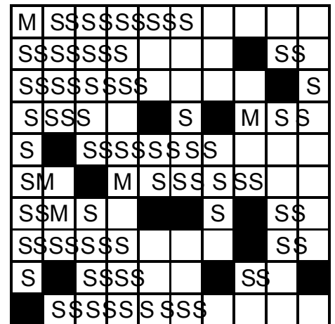
Solució als mots encreuats, 198