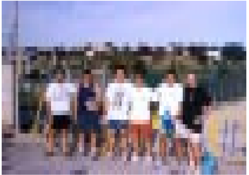
Alguns dels participants al triatló de Cassà, amb el guanyador de la prova.

Cal destacar, entre les activitats programades per aquest mes d'octubre, el dinar social del