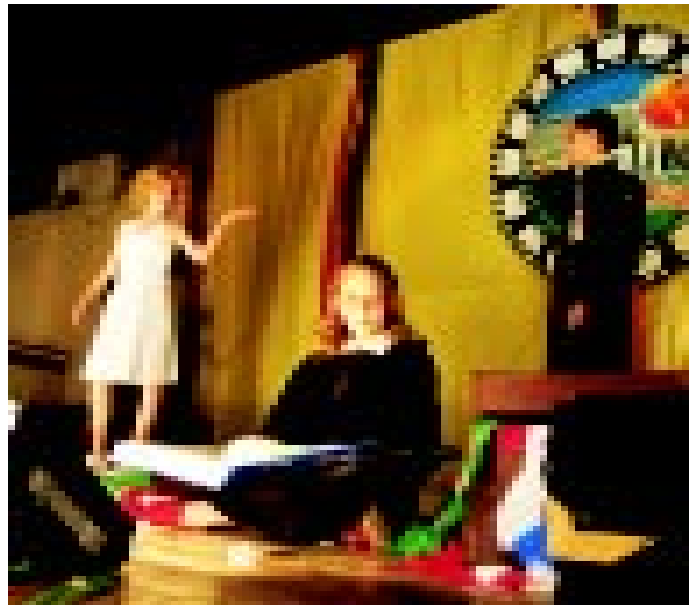
Rocky, Hary Potter, Mary Poppins, Fama... l'escenari del col·legi es va convertir en un plató cinematogràfic, amb un munt de joves actors i actrius

ta edat marca gairebé el final de l'adquisició dels hàbits fonamentals.