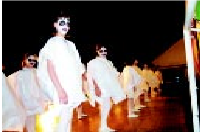
Diversitat d'estils i de temàtiques en les actuacions del festival artístic