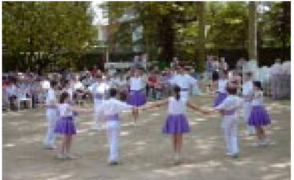
Les colles cassanenques ballant a l'Aplec d'Anglès

Palamós, amb motiu de la celebració del Centenari del Port.