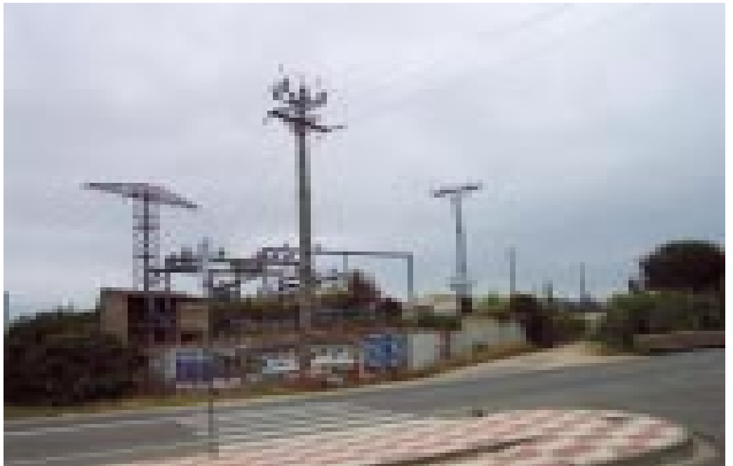
Endesa desmantellarà aquestes instal·lacions i cedeix la finca a l'ajuntament