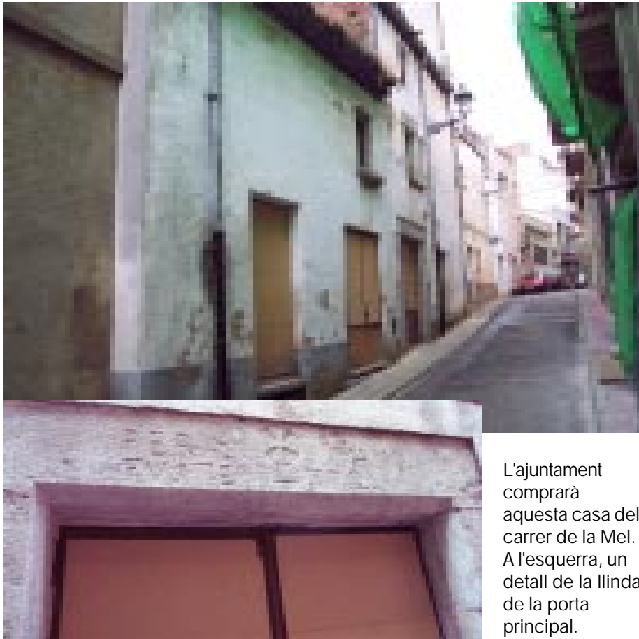
L'ajuntament comprarà aquesta casa del carrer de la Mel. A l'esquerra, un detall de la llinda de la porta principal.

En canvi, en ingressos, tot i que els de propaganda poden superar els tres milions de pessetes, en el bar i entrades als balls no s'arribarà als cinc milions -un menys que l'any passat-, xifra que és gairebé dos milions inferior al conjecturat. Bagué va dir que part d'aquesta reducció era provocada perquè l'actuació del dis-