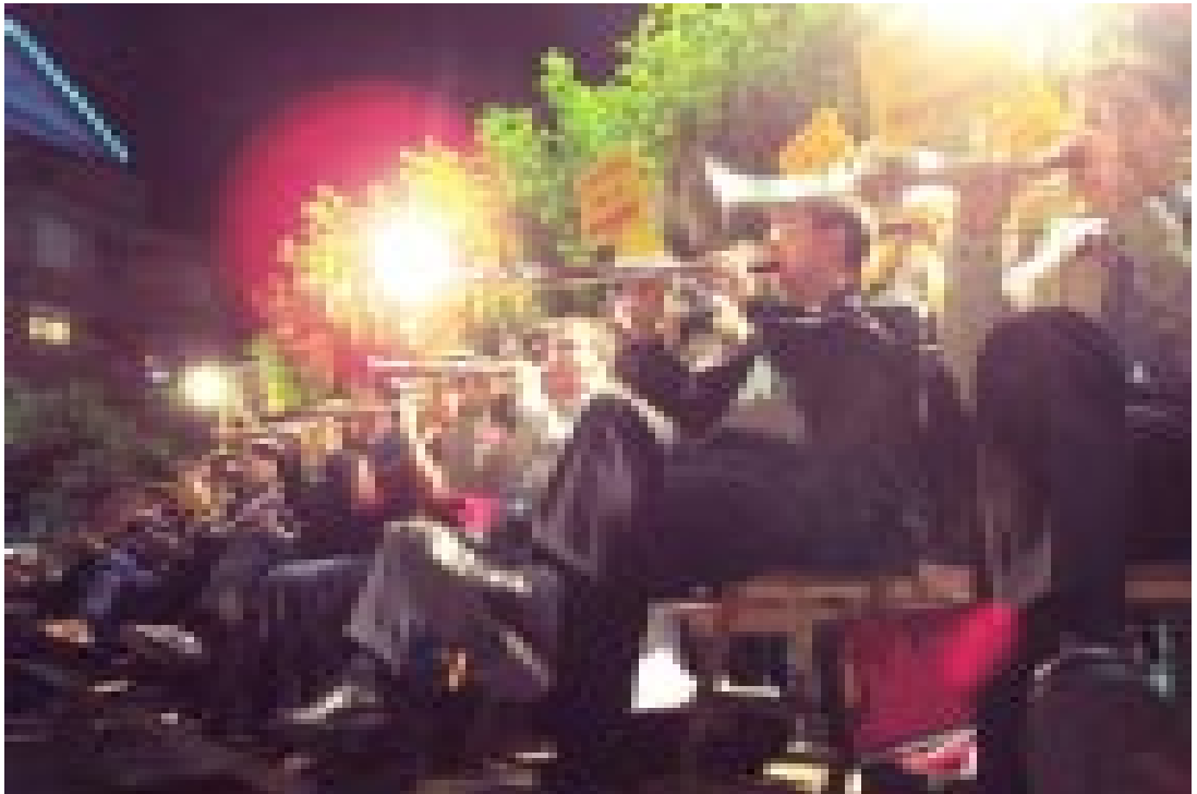
La monumental cobla va protagonitzar la "nit dels músics" que obre la Festa Major