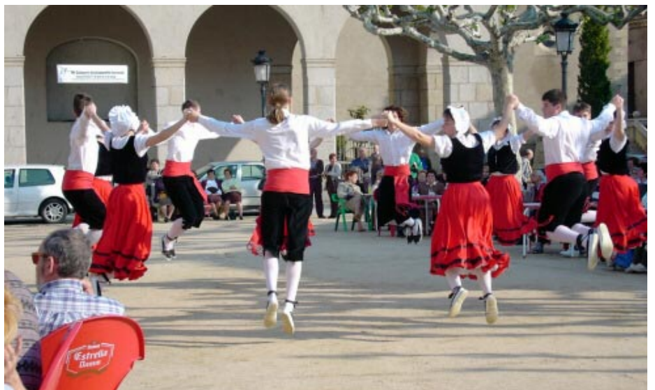
Actuació de l'esbart dansaire de Cassà a la plaça de Santa Coloma de Farners

participants dels punts lliures feien el seu espectacle al mig del camp. La melodia de punts lliures va ser La Segadora de l'avi Xaxu.