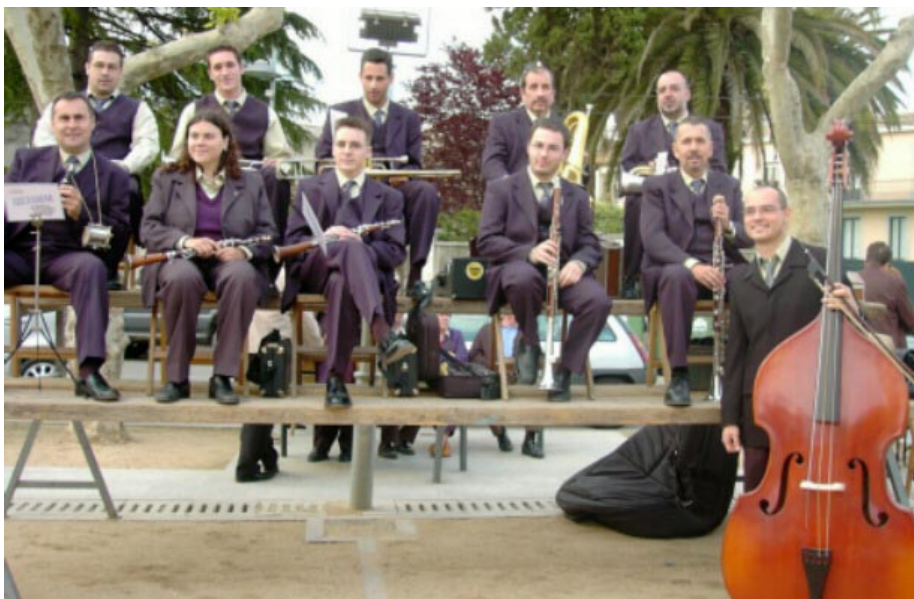
La cobla Selvamar al passeig de Vilaret

Generalitat de Catalunya (Departament de Cultura), Diputació de Girona, Consell Comarcal del Gironès, Ajuntament de Cassà, «la Caixa», Caixa de Girona, Caixa Penedès, Armeria Cassà, Excavacions Alsina, Pere Bosch Coll, Transports Bruçet, Gasolinera Rabell, Neteges Hurpi, Centre Recreatiu, Const. Metal. Roser, Mobles de cuina Ayats, Fusteria Pla, Embotits J. Cañigueral, Hipercongelats Cassà, Robert Bosch, Puig Mias - Expert, Serrerier Garolera, Pastisseria Nèctar, Art Floral, Llibreria Dalmau, Grup de Gestió La Plaça, Construccions Maymí, Instal.lacions Califred