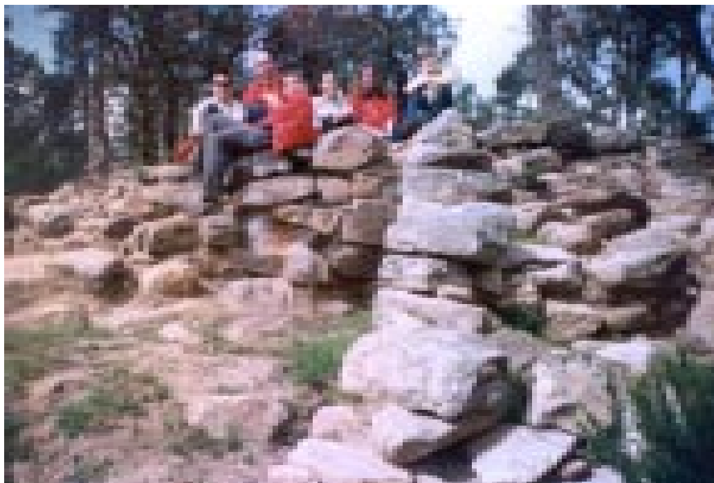
Visita al poblat ibèric del puig del Castell

La nit se'ns va fer curta, però els nostres peus se'n començaven a ressentir. Vam sopar un entrepà de botifarra, i abans d'esmorzar vam beure un deliciós brou ben calentet. També vam descansar en diferents indrets, en alguna església, sota un