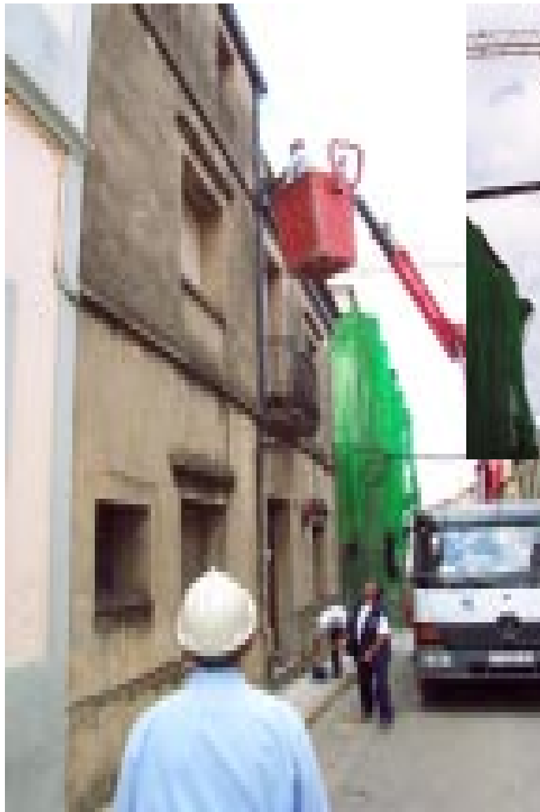
Abans de les obres al carrer del Molí, s'han retirat els cables d'electricitat que el creuaven i s'han renovat els punts de llum. Els veïns no estan d'acord amb el que els tocarà pagar ara amb la reurbanització del sector, promoguda per l'ajuntament.

El debat per les contribucions especials del carrer del Molí va ser el moment