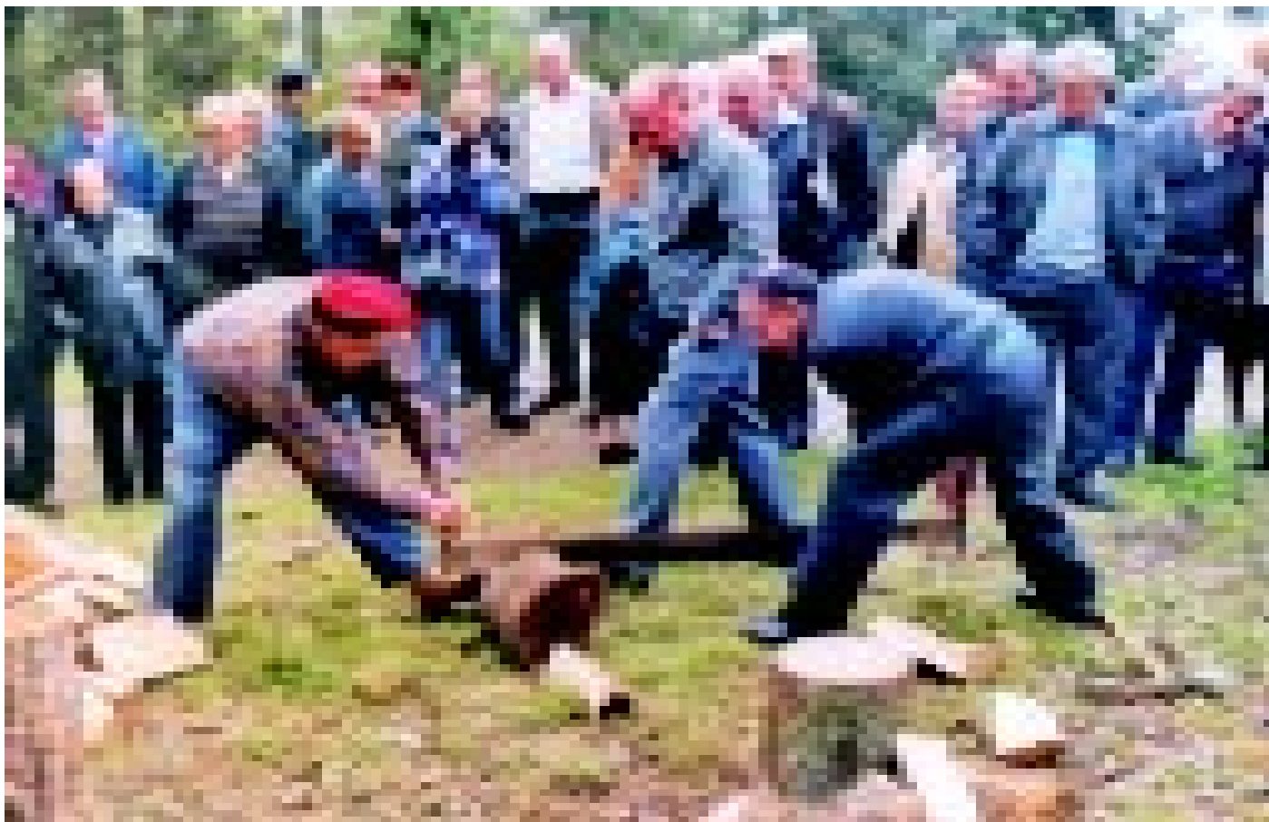
Serrant un soc amb un xerrac de dos, una de les demostracions que es va fer a la Festa del Roser de Santa Pellaia