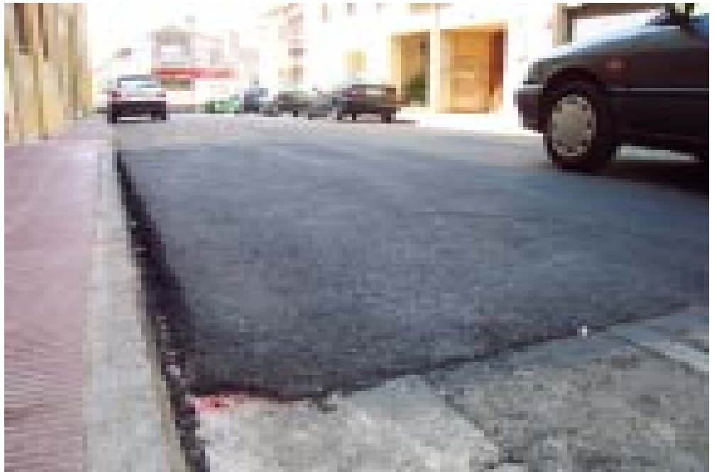
La proliferació de bandes per reduir la velocitat dels vehicles, va ser tema de discussió a la sessió d'abril