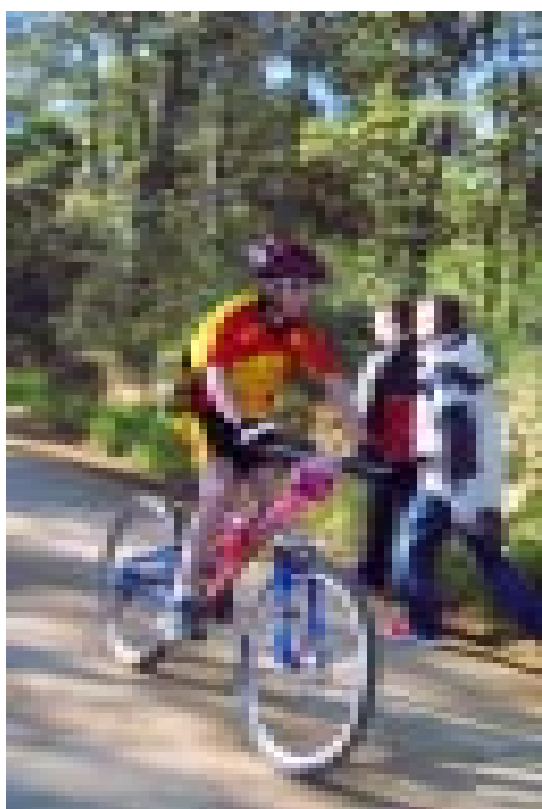
Diverses imatges de les curses de cassà