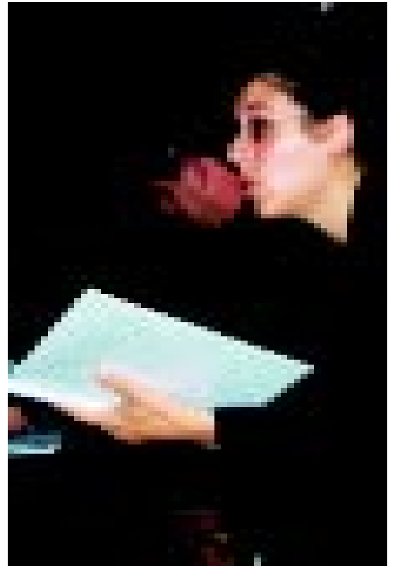
Els alumnes del Liceu Pere Mercader i del grup de teatre La Guspira escenificaren la vida de Mozart