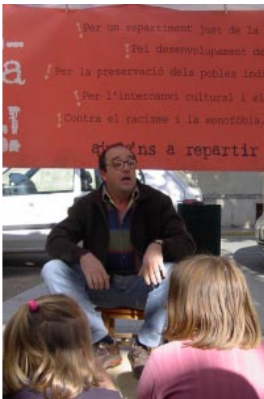
Contes de Xocolata, una activitat que us espera el segon dissabte de cada mes al passeig de Vilaret