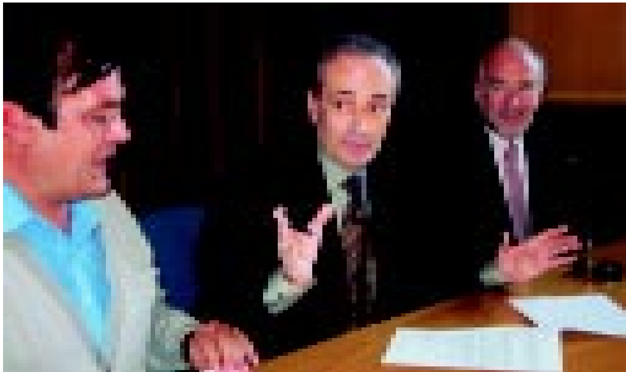
Antoni Baulida, Josep Carreras i Arcadi Calzada, després de la firma del conveni que protocolitza la col·laboració del tenor amb l'ajuntament de Cassà